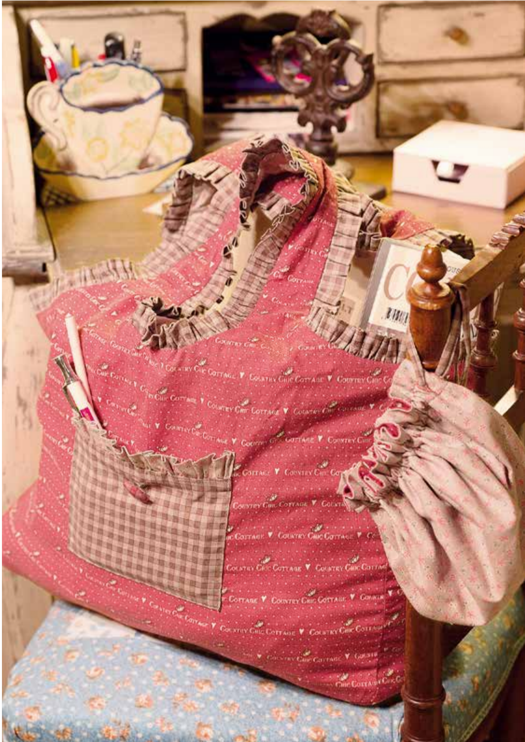
LE GRAND SAC ET SON POUCHON