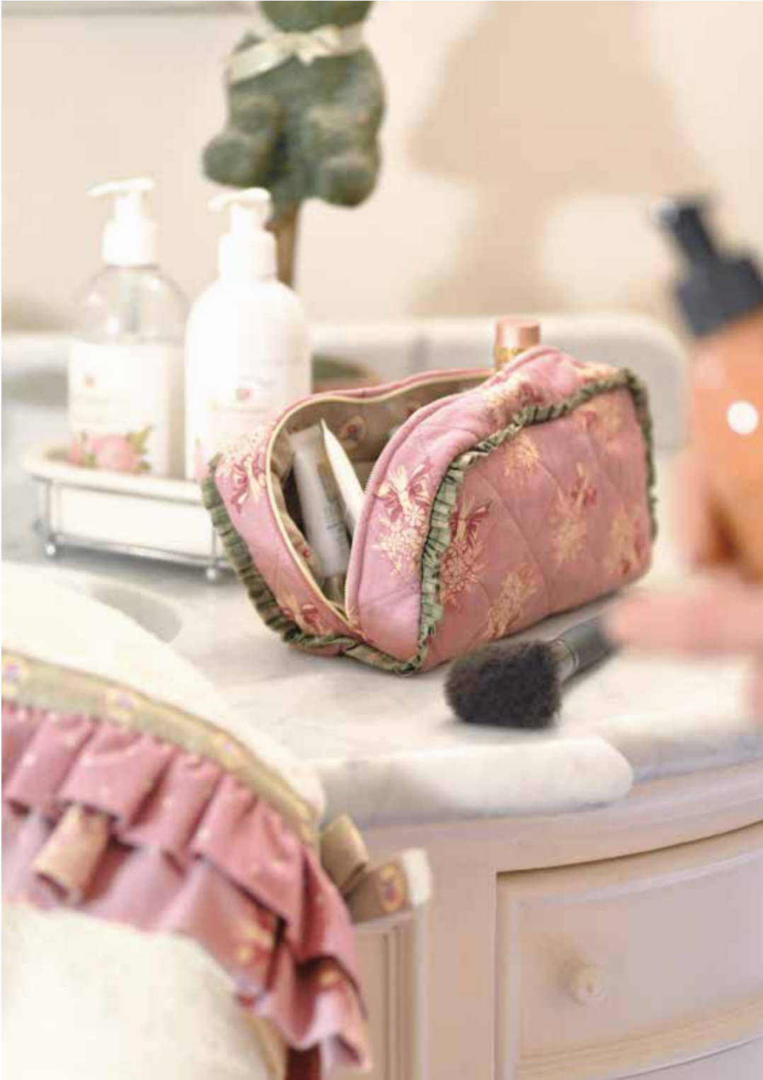
LA TROUSSE DE MAQUILLAGE